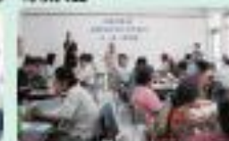
南都地区リーダーの交流会