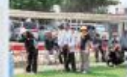
ゲートボール大会