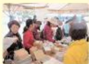
那覇市障がい者福祉センターまつり