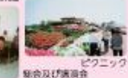
ピクニック 親会及び講演会