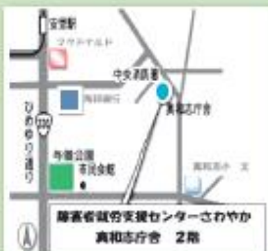
障害者就労支援センターさわやか 真和志庁舎 2階

そうお考えの方は、ぜひ一度さわやかに お電話もしくは来所見学にいらして下さい!相談は無料です。 TEL: 833-7755 FAX: 833-7785